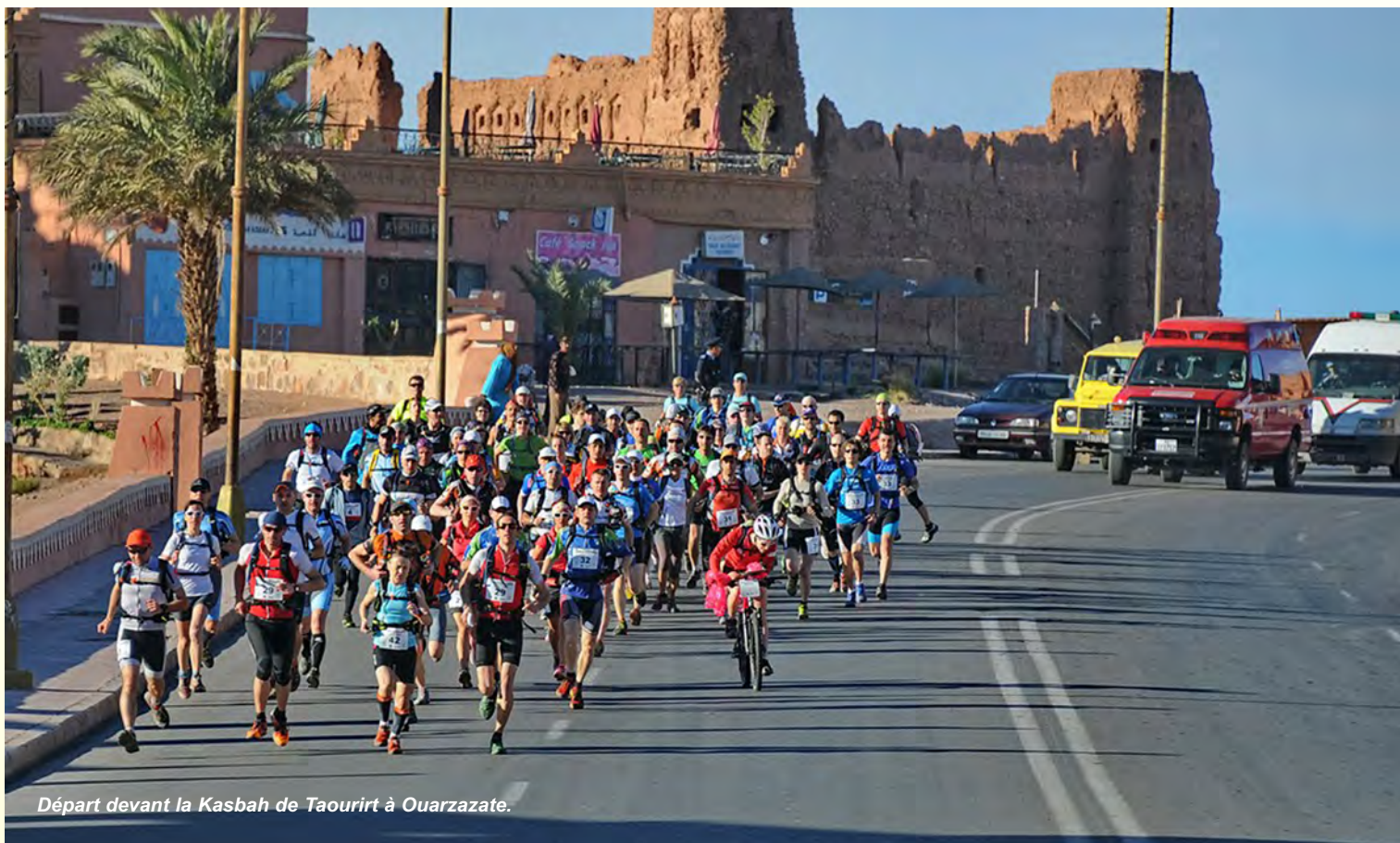
Départ devant la Kasbah de Taourirt à Ouarzazate.

Section 1 : trail suivi d'itinéraire (5 km), Section 2 : C.O. (7 km), Section 3 : Canoë (6 km), Section 4 : VTT (40 km)